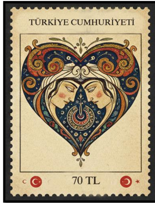
Görsel 5: Hüznün Yansıması