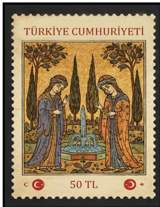
Görsel 4: Serzeniş