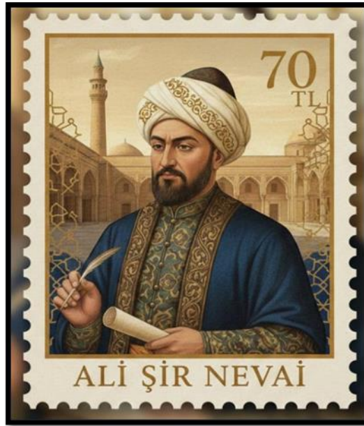
Görsel 2: Ali Şîr Nevai

Türk dil dünyasının önde gelen kişiliklerinden biri olan güçlü bir devlet adamı ve siyasetçi Ali Şîr Nevai'nin üzerine yapılan hatıra pullarında, sanatçının edebi kimliğini ve kültürel mirasını yansıtan görsel unsurlar görülmektedir.