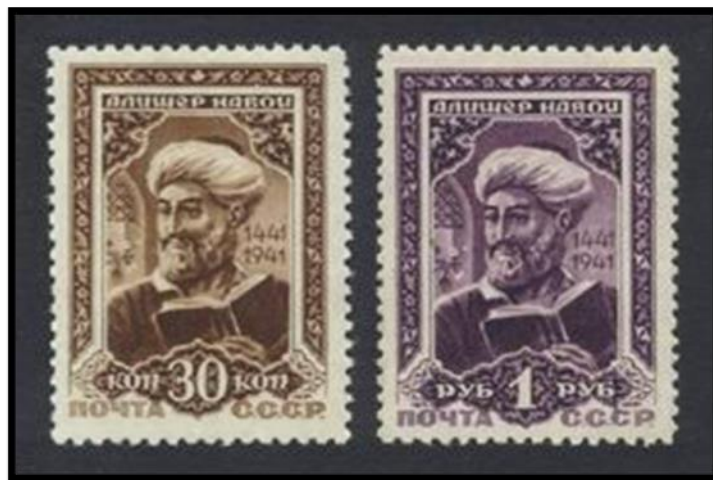
Görsel 1: 1942'de Ali Sir Nevai'nin 500. doğum yılı anısına Sovyetler Birliği tarafından bastırılan pullar (USSR stamps, Ali-Shir Nava'i (designed by Ivan Dubasov), 1942, 30 kopecks and 1 rouble, CPA 827-828, Scott 857-858).

Günümüzde Ali Şir Nevâî'nin adı üniversitelerde, şehir adlarında, anma programlarında ve çeşitli görsel kültür ürünlerinde yaşatılmaktadır. Bu durum, Nevâî'nin tarihsel kişiliğinin çağdaş temsiller aracılığıyla kolektif hafızada yeniden üretildiğini göstermektedir. Dolayısıyla Nevâî, yalnızca edebiyat tarihinin değil, kültürel temsiliyet ve simgesel kimlik çalışmalarının da önemli bir referans noktasıdır.